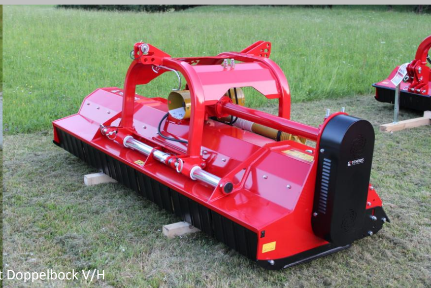
Fotos mit Doppelbock V/H