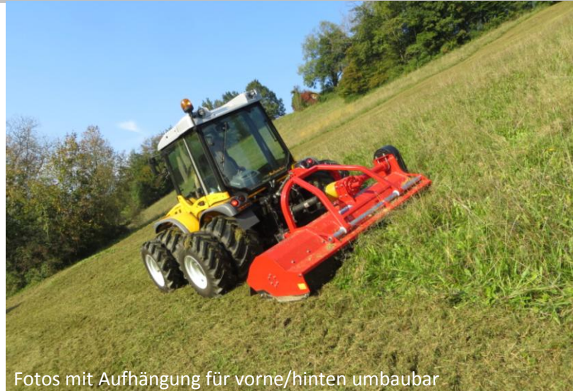
Fotos mit Aufhängung für vorne/hinten umbaubar