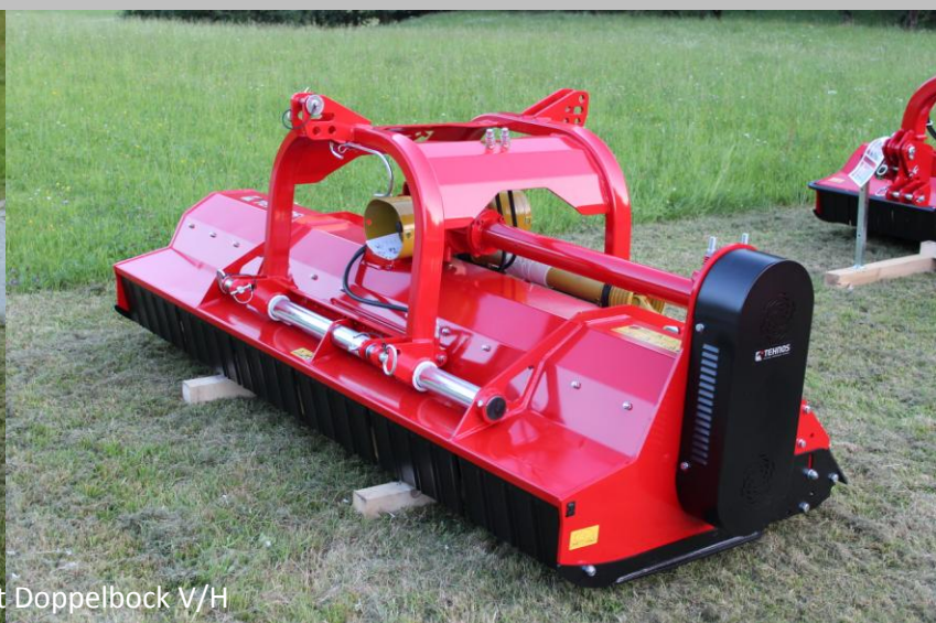
Fotos mit Doppelbock V/H